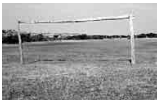
Sopra: bimbi africani giocano col pallone. "Architecture for humanity" ha lanciato una competizione internazionale per progettare un campo di calcio: «Aiuta a combattere l'Hiv». Ai lati: il luogo dove sarà collocato l'impianto sportivo.

grazie alla fama acquisita dal gruppo, promette la realizzazione del progetto vincitore. Ma perché un campo di calcio? Lo spiega Sinclair: quando tennero il concorso per gli ospedali da campo per i malati di Hiv, entrarono in contatto con la comunità Kwazulu, dove il 45% della popolazione è colpita dal virus. «Le ragazze tra i 19 e i 15 anni sono quelle più a rischio. Il Sudafrica - spiega l'architetto - è, tra i paesi "sviluppati", quello dove la percentuale di donne sottoposte a violenza carnale è maggiore». Le ragazze nelle zone rurali sono costrette a chiudersi in casa e non hanno accesso all'educazione come i ragazzi. Accade che due infermiere che parteciparono al progetto per gli ospedali d'emergenza, erano giocatrici di calcio: «Hanno proposto di costituire una squadra per ragazze - racconta Sinclair - All'inizio pensammo semplicemente di fornire equipaggiamento sportivo. Poi vedemmo che c'era la possibilità di creare un nuovo centro comunitario. Giocare assieme è un modo per educare le persone». La chiave di tutto è nel realizzare progetti che abbiano un significato immediato per le comunità. Nella giuria vi saranno per questo esponenti della comunità stessa, oltre che esperti nel gioco del calcio.